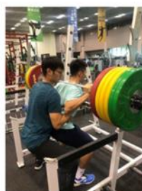
重量訓練與體能訓練